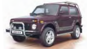
4x4 Only Spezial